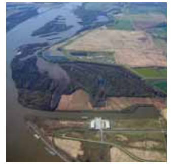
平潮港有170英尺长的码头。

小石城港属于1971年建成的448英里的麦克莱伦-克尔阿肯色河航行系统的一部分，该航行系统从密西西比河的西北方向运行到塔尔萨以东15英里。